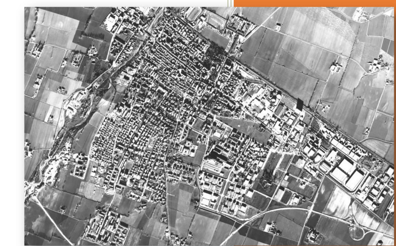
Tavola 1 - Classificazione acustica del territorio comunale Approvazione ai sensi della L.R. 15/2001

Adozione con D.C.C. n. del Controdeduzione con D.C.C. n. del Approvazione con D.C.C. n. del